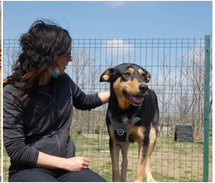
Räddningen av mamma Ines och hennes valpar: