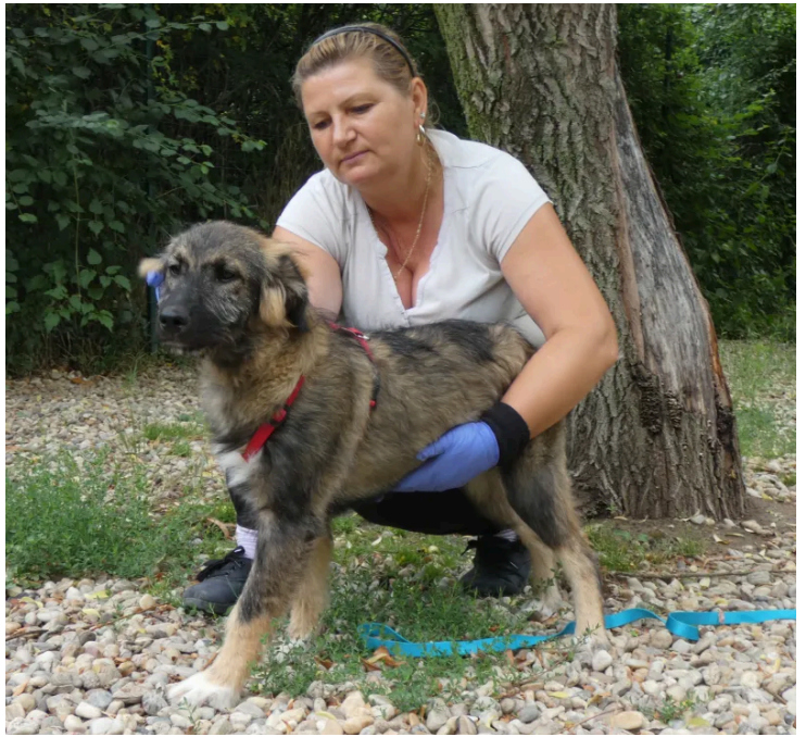
Räddningen av syskonen: